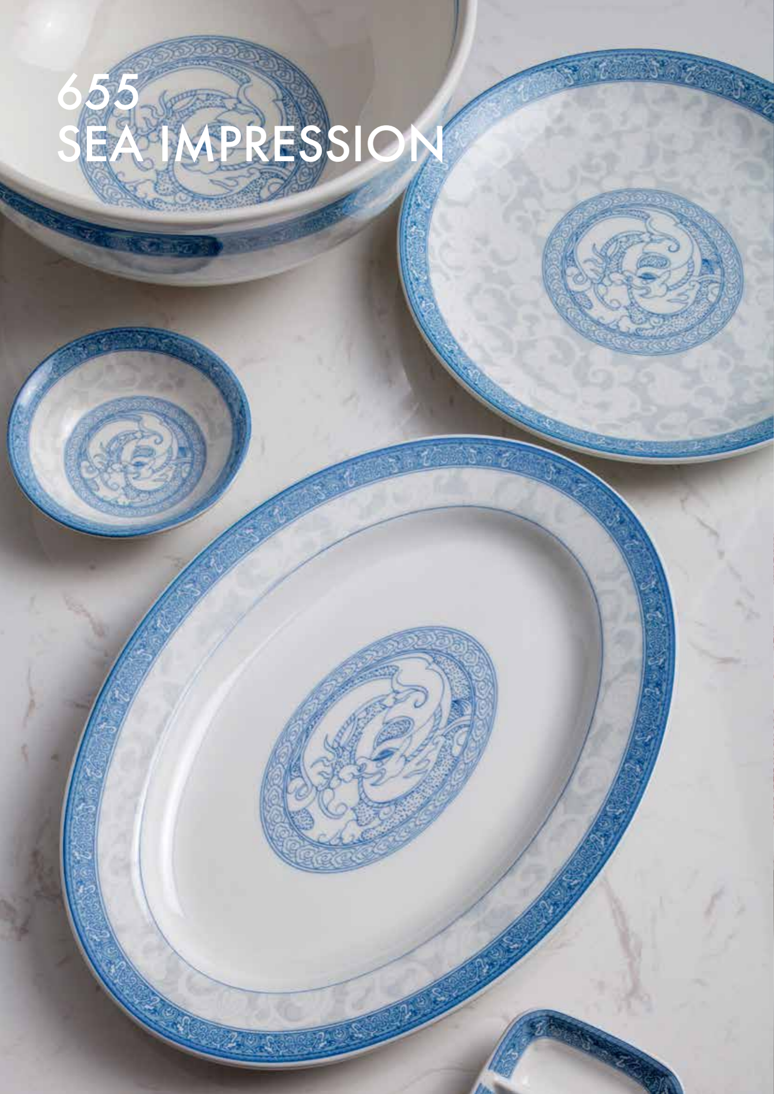
655 SEA IMPRESSION